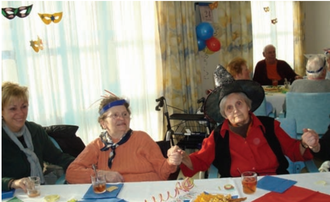
Lachen macht gesund

lachen und weinen, plaudern und schweigen, sich wohlfühlen und angenommen sind.