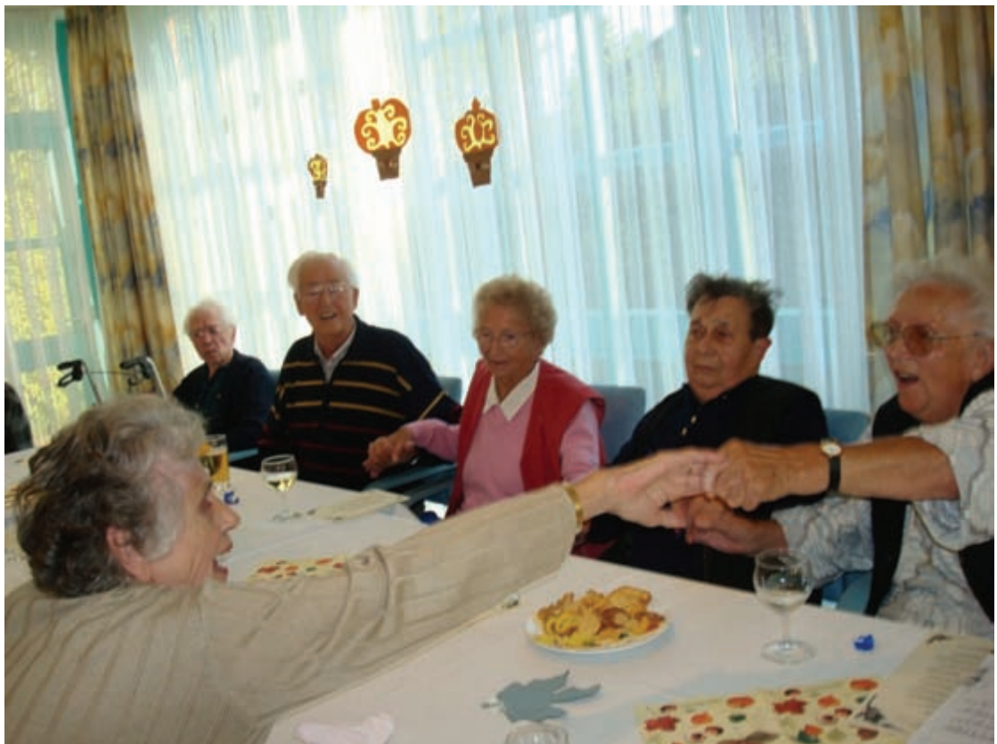
Freude am Leben ist das höchste Ziel im Haus